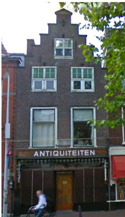
Kort Rapenburg 12 met gedenksteen.

hebben ondertekend bij de notaris Paedts in Leiden. Het is mij nog niet gelukt dit testament in het Notarieel Archief te vinden.