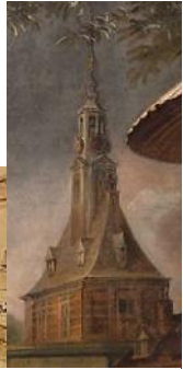
Blauwpoort - 1602

van laatstgenoemde soms veel meer op dan die van Rembrandt. Prijzen van 400 tot 1000 florijnen waren niet ongebruikelijk. En dat in een tijd waarin een top hoogleraar een topjaarwedde moest bedingen van 1200 gulden per jaar (Scaliger).