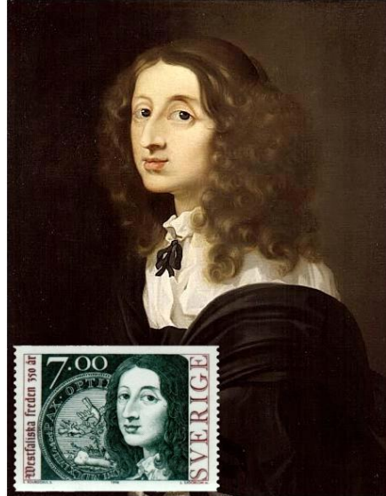
koningin Christina van Zweden (1626-1689) portret van Sébastien Bourdon (1616-1671) zegel 350 jaar Vrede van Westfalen (1648)