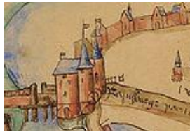
Lopsenpoort - 1355

Op dit schilderij ziet u de toren van de Blauwpoort, die in de plaats kwam van de Lopsenpoort aan het eind van de Haarlemmerstraat.