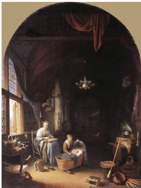
De jonge moeder (1658) olieverf op paneel 73,5 x 55,5 Mauritshuis - Den Haag

Met een vergrootglas zorgde hij ervoor dat iedere penseelstreek glad werd. De toon werd intiemer en het lichtdonker werd in een verstild zilvergrijs weergegeven.