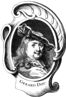
uit: 'Abrégé de la vie des plus fameux peintres' Antoine-Joseph Dezallier d'Argenville

Er zijn weinig werken van Dou in Leiden aanwezig terwijl ze in de musea van de hele wereld tot in Noord en Zuid Amerika en in heel Europa, van Rusland tot in alle landen om ons heen 'bij bosjes' hangen.